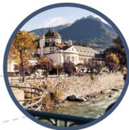
Kurstadt | Città di cura Spa town Meran / Merano