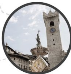
Kulturstadt | Città di cultura Cultural city Trient / Trento