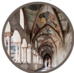
Tirols Älteste | La più vecchia del Tirolo The oldest in Tyrol Brixen / Bressanone