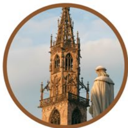
Landeshauptstadt | Capoluogo Regional capital Bozen / Bolzano