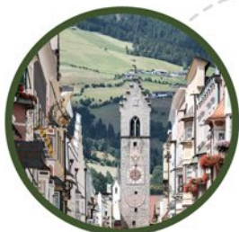
Alpinstadt mit Charme Città alpina caratteristica Charming alpine city Sterzing / Vipiteno